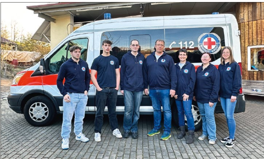
Von links auf dem Foto: